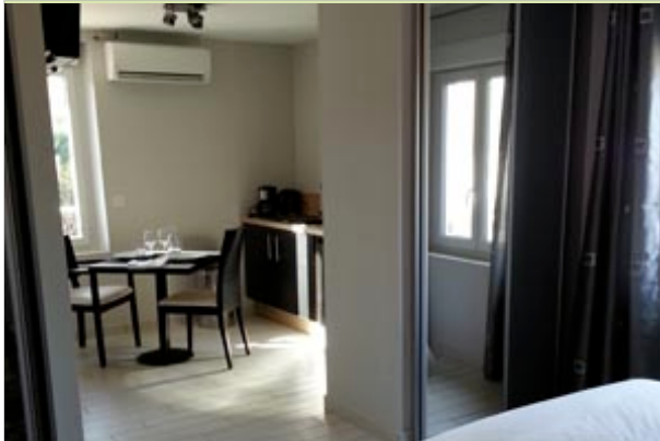
La Belle Epoque - Le Bugarel 82800 BRUNIQUEL