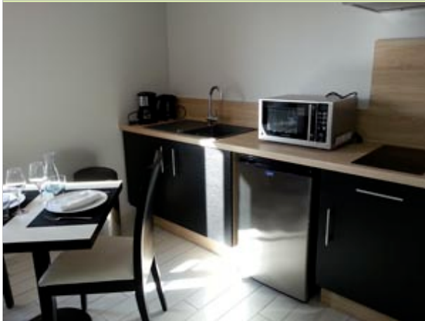
A Fleur d'Eau - Le Bugarel 82800 BRUNIQUEL