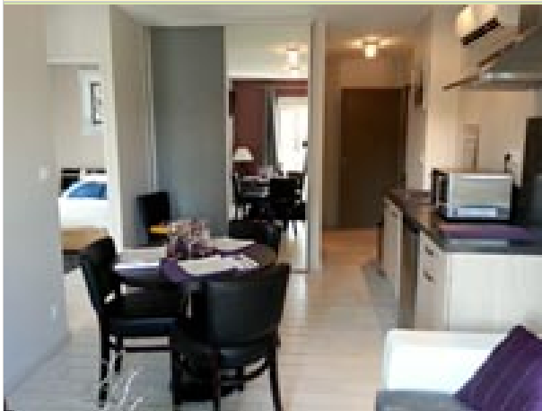
Le Trésor des Papilles - Le Bugarel 82800 BRUNIQUEL