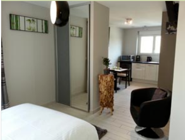
Au Coeur de la Nature - Le Bugarel 82800 BRUNIQUEL